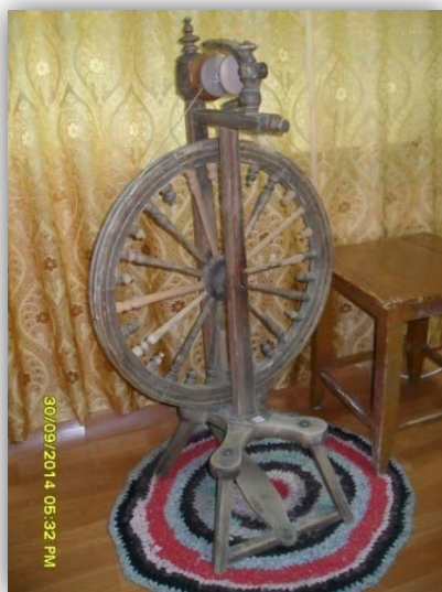
Прялка бабушки Ефимьи

Блок отвечает за скорость скручивания нити. Его устанавливают на головке. Тормозное устройство давит на катушку, замедляя ее вращение. Приспособление для натяжения ремня собственно контролирует его натяжение. Чем оно больше, тем быстрее вращается колесо. Чем быстрее вращается колесо, тем быстрее нить наматывается на катушку. Если ремень ослабить, колесо будет вращаться медленнее, нить медленнее будет наматываться на катушку, но будет более скрученной.