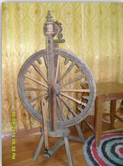
Прялка бабушки Ефимьи

Деревянная прялка приспособлена для ручного прядения. Прялка с приводом на катушке приводится в движение ножной педалью. Боковые стойки прялки поддерживают вращающуюся головку. Их можно сдвигать для установки или снятия катушки. Вращающаяся головка U-образной формы, с крючками вдоль лапок. Нить проходит сквозь отверстие впереди головки, над крючками и наматывается на катушку. Нить передвигают с крючка на крючок, чтобы катушка заполнялась равномерно. Катушка наматывается медленнее, чем головка, и нить наматывается на катушку сама. Когда катушка заполняется, ее можно снять и поставить на полочку.